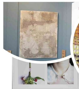
SECOND LIFE: Tutto torna Arte, bellezza e sostenibilità ambientale